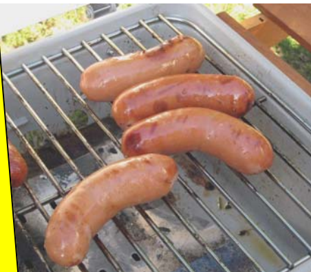
Inget talko utan korv och läsk.