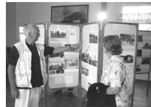
Minnesgruppens fina fotoutställningar på sommarfesterna var mycket omtyckta.