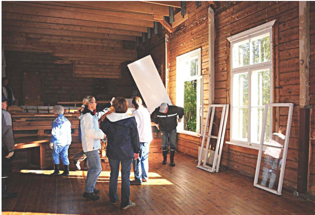
Här skall festsalen tömmas - allt skall ut! Bild från höstens första talko i oktober, när festsalen tömdes på bråte och danslaven täcktes in med presentningar.