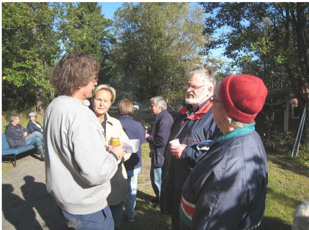
Övre bilden: Först flyttade de pianot... Nedre bilden: Talkogänget tar igen sig i höstsolen.