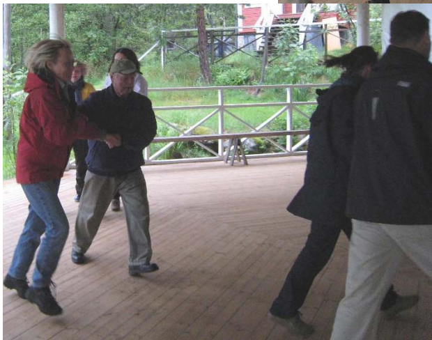
Ritsch ratsch filibom bom bom...