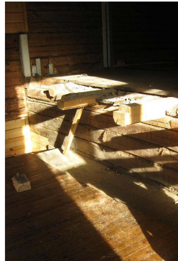
Höstsolen hittar sin väg in på scenen, som redan sett sina bästa dagar... Stockväggen under scenens framkant är originalkonstruktion.

TALKO LÖRDAGEN DEN 21 NOVEMBER KL. 11.00 KOFÖTTER OCH GOTT HUMÖR BÖR TAS MED!