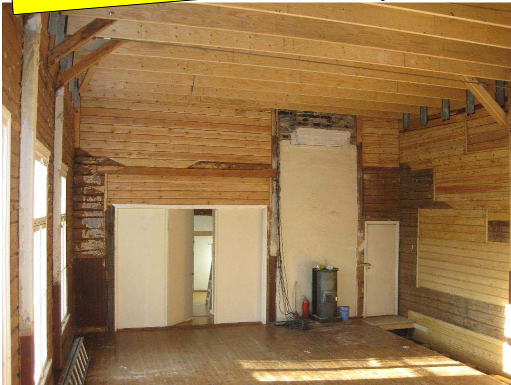
Så här prydligt blev det när talkogänget hade städat. Här ses också hur mycket av stockarna i festsalens södra vägg har bytts ut!